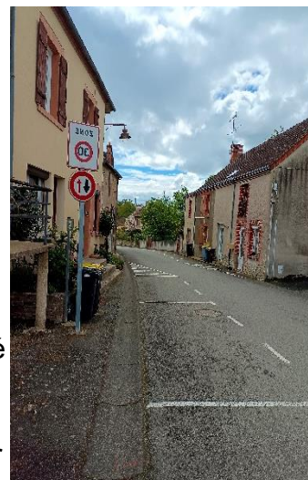
Rue de la Cascade

Certes le 30, vitesse maximale dans le bourg, n'est pas toujours respectée, mais la matérialisation facilite le stationnement et la sortie du parking de l'école est nettement plus dégagée. Nous n'avons pas enregistré de réactions d'opposition, aussi allons-nous consolider ce dispositif.