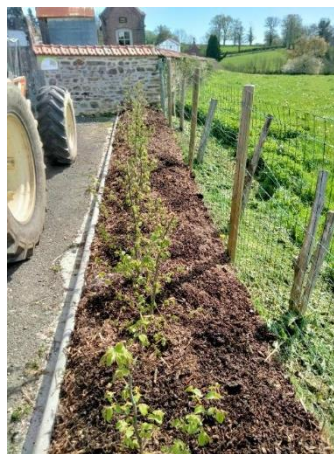
Charmille à l'entrée du cimetière

Mais cet hiver n'a pas été très froid, cela a permis à notre agent d'entretien de procéder à de nombreux petits travaux tels que les aménagements paysagers avec la plantation de charmille au cimetière et de junipérus à proximité du local des Infirmières.