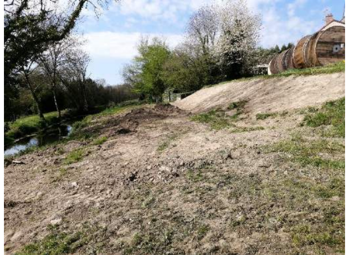
Phase de travaux